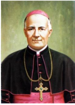
Św. Józef Bilczewski, biskup

Józef Bilczewski urodził się 1860 r. w Wilamowicach koło Kęt. W 1880 r. wstąpił do seminarium duchownego w Krakowie, a w 1884 r. przyjął święcenia kapłańskie. W 1888 r. ukończył doktoranckie studia teologiczne w Wiedniu, w Rzymie i Paryżu. W 1890 r. uzyskał habilitację na Uniwersytecie Jagiellońskim. W rok później został profesorem teologii dogmatycznej na Uniwersytecie Jana Kazimierza we Lwowie, na którym przez pewien okres pełnił funkcję dziekana i rektora. Był bardzo ceniony przez studentów, cieszył się szacunkiem i przyjaźnią innych pracowników naukowych. W 1900 r. Leon XIII mianował 40-letniego ks. prał. Józefa Bilczewskiego arcybiskupem lwowskim obrządku łacińskiego. Był mężem modlitwy, fundował kościoły i kaplice, szkoły i ochronki, krzewił oświatę. Wspierał duchowo i materialnie wszystkie ważniejsze dzieła powstające w archidiecezji lwowskiej. W czasach I wojny światowej rozwijał kult Najświętszego Serca Pana Jezusa, ukazując ludziom nieskończoną miłość Boga, a Matkę Naj-